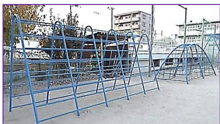
【左:山形肋木 右:アーチラダー】

◆安全部会では、昨年度より西小学校遊具のペンキ塗りをしています。10月19日(土)参加者8名で9時から11時30分まで、運動場西側にある遊具『山形肋木』『アーチラダー』にペンキを塗りました。小雨の中懸命に作業しました。(肋木:ろくぼく・ラダー:梯子)