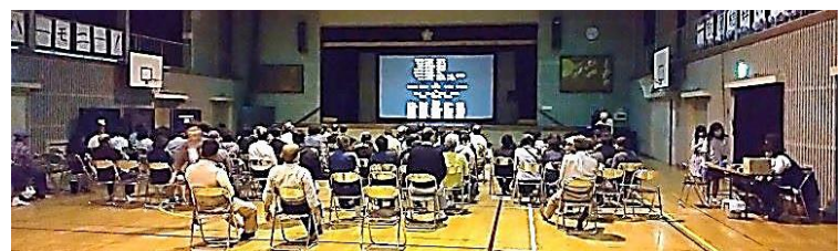
【昔,学校の講堂で教育映画を見た思い出がよみがえりました】

本庄コミュニティセンター・西公民館 合同事業 ひとまち未来づくり 西学区から ～手・話・漫・才～